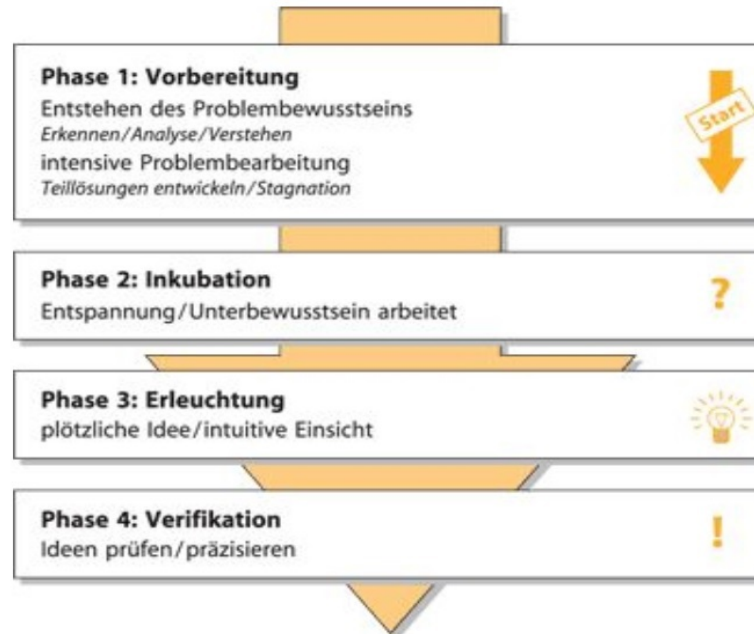
Bild 1. Der kreative Prozess. Quelle: Schlicksupp, H.: Innovation, Kreativität und Ideenfindung, 6. Auflage, München 2004.

Screenshot vun folgender Websäit gehuel (am 2. Band vun Erziherrinnen an Erzieher steet och eppes do driwwer dran):